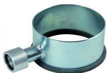
jímací kruh WR 130 pro EFB 152