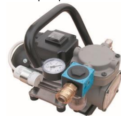
vakuovací pumpa do 182mm