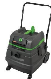
průmyslový vysavač 50l