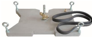
vakuovací deska 300-350mm