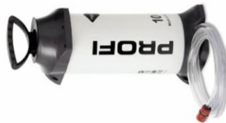
tlaková nádoba 10l