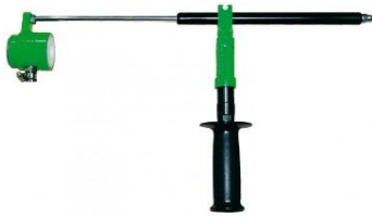
centrovací přípravek odsávání END