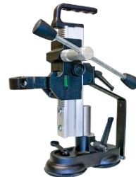
přísavný stojan pro END 1550P