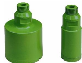
diamantová korunka R 1/2"