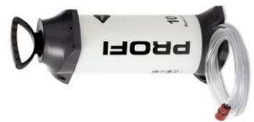
tlaková nádoba 10l