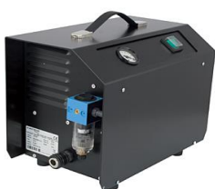
vakuovací pumpa do 350mm