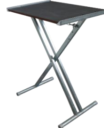
přídavný stůl pro EFB 152