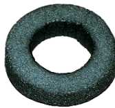
náhradní guma 35836000 max.30mm