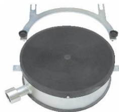
jímací kruh WR 160/200/300/350

1405,-Kč 1470,-Kč 1525,-Kč 36395000 36394000 36391000