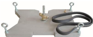
vakuovací deska 160mm