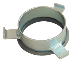
redukce pro EFB 152