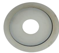
náhradní kroužek dle průměru